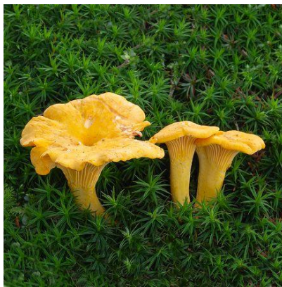
Pieprznik jadalny, Kurka