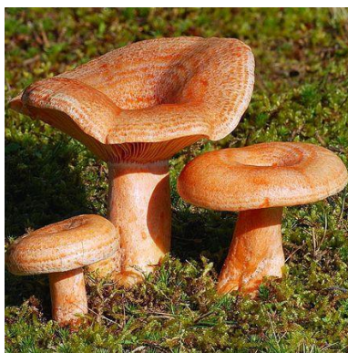
Mleczaj rydz, Rydz