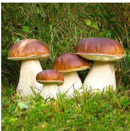
Borowik szlachetny, Prawdziwek