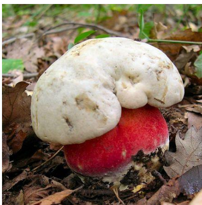
Borowik szatański -