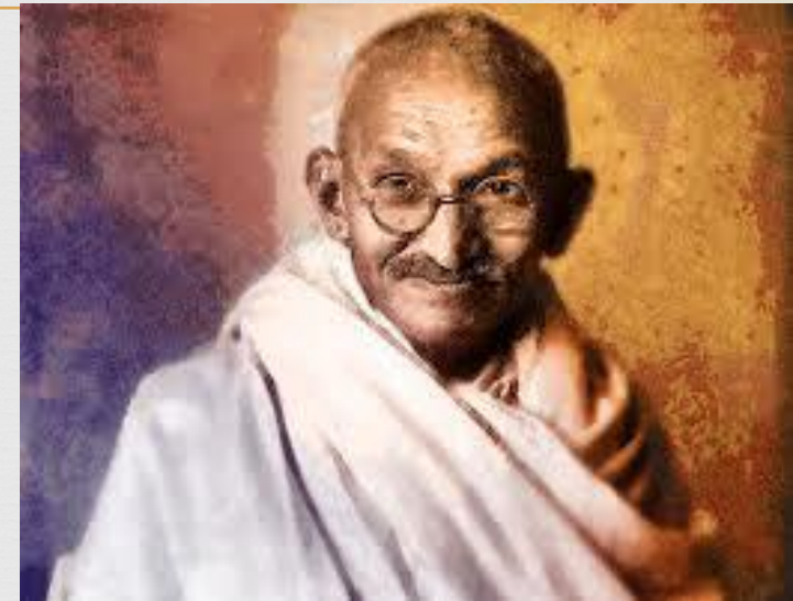
Mahatmá Gándhí (1869 – 1948) politický vodca indického ľudu v boji za nezávislosť