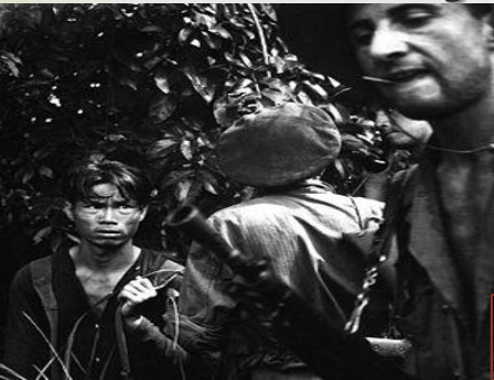
Francúzski legionári vo vojne v Indočíne