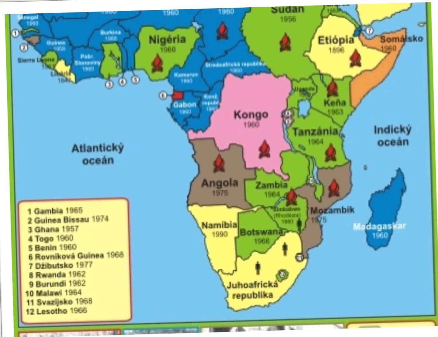
Rozklad koloniálneho systému v Afrike