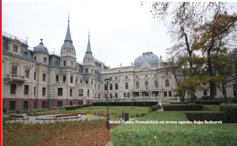
Widok Pałacu Poznańskich od strony ogrodu, Kuba Bednarek

Obecnie Pałac Poznański jest otwarty do zwiedzania, gdzie można zwiedzić ogród i wnętrza Pałacu.