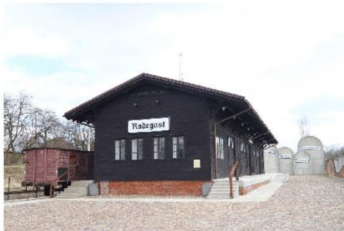
Opracował: Kacper Galaman, 7a

Na ekspozycji w budynku stacyjnym mieści się makieta Litzmannstadt Getto. Jest to największa tego typu makieta w Polsce przedstawiająca wygląd dzielnicy zamkniętej w 1942 roku. Oprócz makiety prezentowane są reprodukcje list wywozowych mieszkańców getta. Niedaleko Stacji znajduje się Tunel Pamięci, gdzie widnieje napis „Nie zabijaj” w języku niemieckim, hebrajskim i polskim.