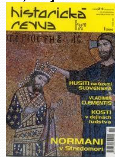
Časopis o histórii